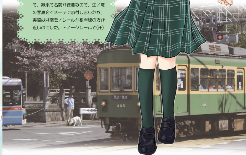
鎌倉女子大学中等部制服