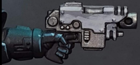
4. Basalt grey + white