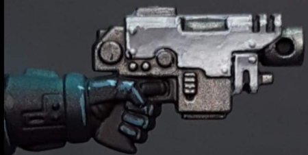
6. I do some glazes to the bottom with white and some edgehighlgh. Hago alguna veladura con blanco hacia abajo y perfilo