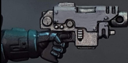
3. Ak Basalt grey