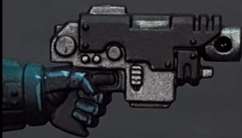
2. Ak Gun Metal Nuln oil wash Ladado nuln oil