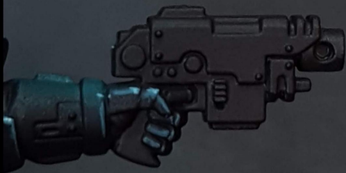
1. AK Black