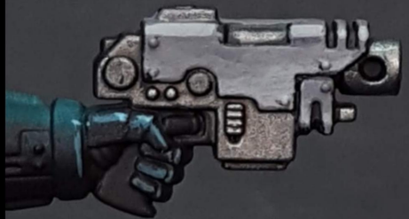
5. I disguise the transition with a midtone Disimulo la transicion con un tono medio